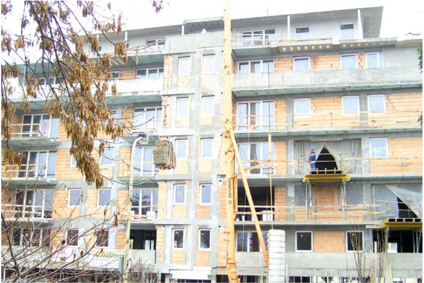
Hol van itt a hőhídmentes felület?

ként tudnak jelentkezni. Tulajdonképpen hőhíd a negatív falsarok is, hiszen itt ugyanúgy többdimenziós hőáram alakul ki, mint a pozitív sarkoknál, csak itt – mivel a lehűlő felület kisebb, mint a fűtött – nem lesz többletenergiavesztés. Ha figyelembe vesszük, hogy a hőhidak többnyire a falvastagságnál kétszer szélesebb sávban fejtik ki hatásukat, és a jelenlegi gyakorlat a 35-45 cm vastag fal, úgy könnyen beláthatjuk, hogy nincs olyan felülete a homlokzatnak, amelyen ne érvényesülne a geometriai hőhíd hatása. Ennek az a következménye, hogy sem az épület energiafogyasztása, sem pedig a falfelület belső felületi hőmérséklete nem fogja elérni a tervezett szintet.